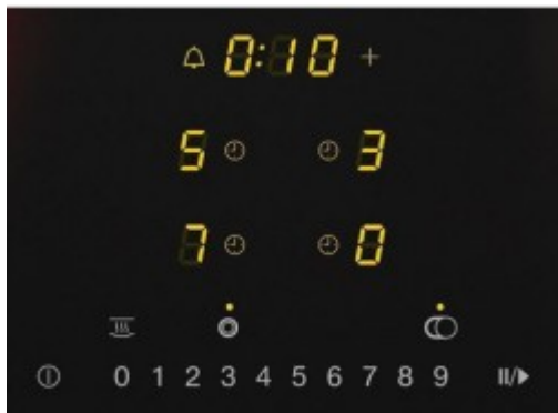
КМ 6540 FR